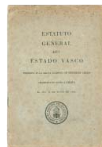
Euskal Estatuaren Estatutu Orokorra 1931ko ekainaren 14an Lizarran egin zen Euskal Udalen Biltzar Nagusian onetsitakoa.

teresen gaitetik zegoenez, Errepublikaren nekazal legediaren aurka agertu zen landa eremuko milaka nekazarien kutxa eta sindikatu katoliko hartzen zituen Nekazarien Konfederazio Nazional Katolikoaren jardunak agertu zuen moduan. Lurrik gabeko nekazariak politika tradizionalistatik kanpo geratu zen.