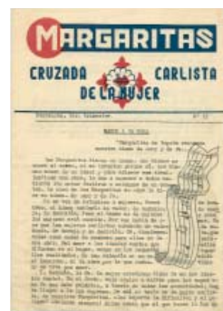
Margaritas. Cruzada de la mujer carlista